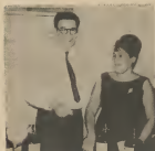
Milda Tromp de Turbana no. 4, Noord